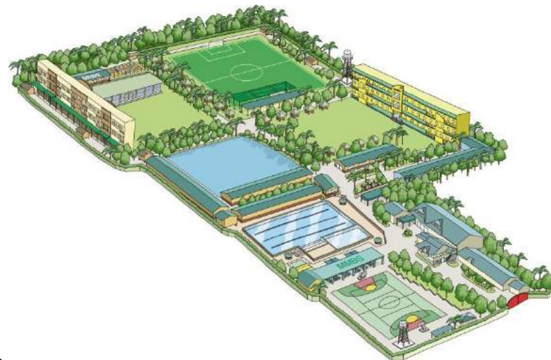
▲3ヘクタールの学校敷地内地図