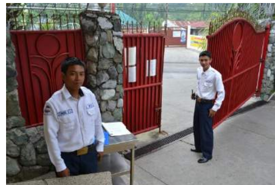
▲セキュリティーガードは2交代6人体制

フィリピンと聞くと危険なイメージを持っている方も多いでしょう。半分は事実ですが、半分は皆様の心がけひとつで半減できることです。しかし、外国人の私たちが安心して過ごせる生活環境を保持することはとても大変です。MMBSが安全な環境であることは、最初は保護者の方と一緒にご留学に来た未成年者のお子様、次からは単身でMMBSに留学に来ることで証明されています。実際に保護者の方が体験し、確認して、満足された結果がここにあります。