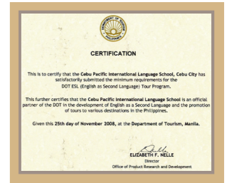
フィリピン政府観光省ESLパートナー校として認定された表彰状。CPILSはセブ島で唯一のフィリピン政府観光省ESLパートナー校です。

マブハイ! 太平洋に浮かぶ7107の島々からなるフィリピンへようこそ。私達の国は、アジア特有の雰囲気、味わえるマニラをはじめ、美しい快適なビーチリゾートセブ島等、バラエティ豊かな楽しみのできるプレミアム・リゾートアイランドです。最近では観光だけでなく、「会社の研修」や「語学留学」も多く、特にフィリピン人のフレンドリーな性格、またきれいな英語というもの注目され、幅広い年齢層の方がたくさん訪れます。その為フィリピン政府としても日本人の皆様が安心して滞在出来る様、環境の整備や治安の維持に一層の努力をしております。どうぞ安心してフィリピンにいらしてください。皆様がお来し頂くこと心よりお待ち申し上げます。