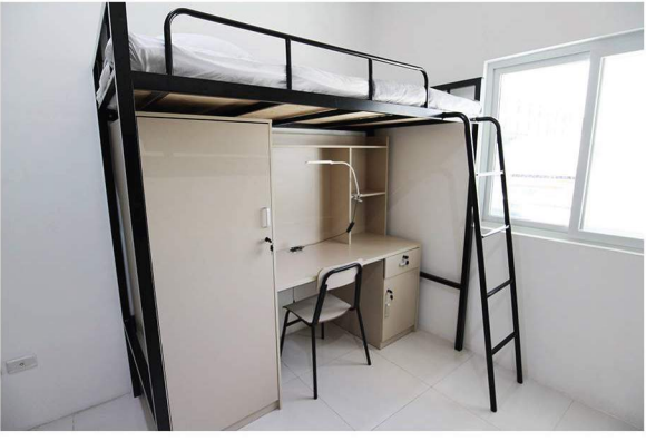
内部寮(デスク・クローゼット付)