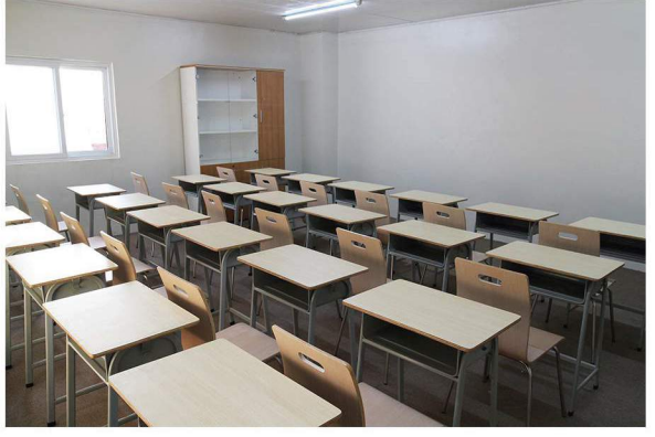
テスト・オリエンテーションルーム