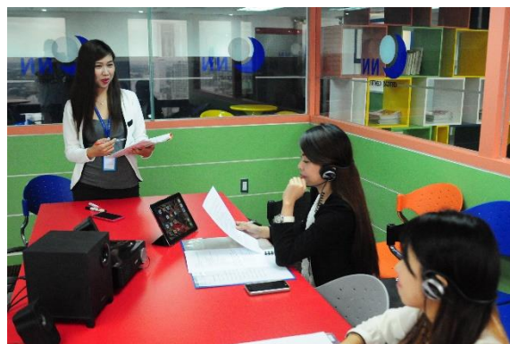
◆グループレッスン室