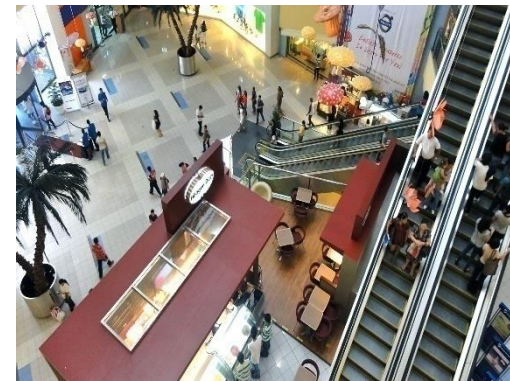
◆ Shangri-La Plaza