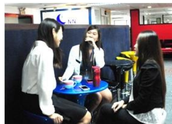
◆スタディラウンジ