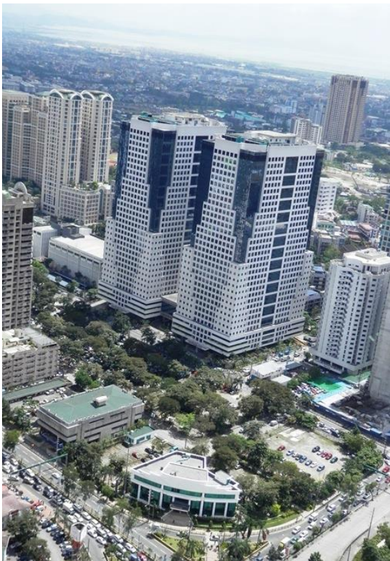
◆ PHILIPPINE STOCK EXCHANGE CENTER

教室はメトロマニラ屈指の金融街オルティガス比証券取引所のあるビルの24Fにあります。 周辺にはメガショッピングモールやレストラン街のほか、アジア開発銀行もこの街にあり、治安の良さも抜群です。