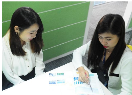
◆マンツーマンレッスン室