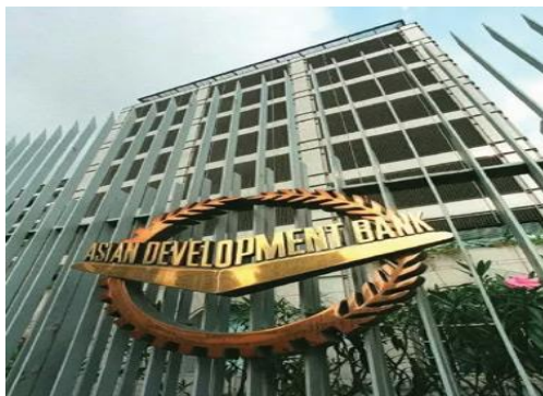
◆ Asian Development Bank