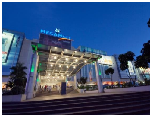
◆ SM MEGA MALL