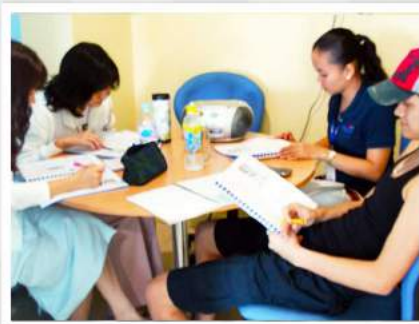
1 : 4 クラスルーム