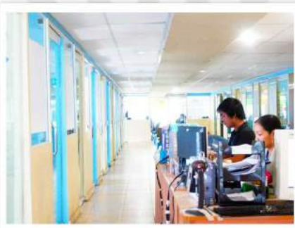
学校施設 歩きやすく広い学校ホール