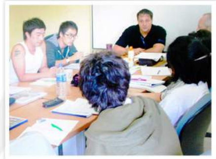
1 : 8 クラスルーム