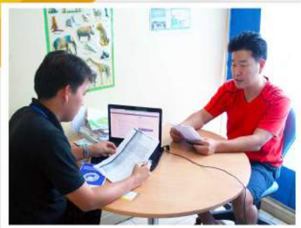
1 : 1 クラスルーム