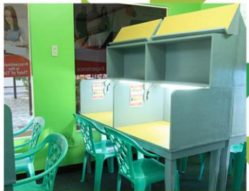
スタディーホール

CIPの施設は学生が快適に、そして勉強に集中して過ごせるよう、常に清潔を保てるよう心がけています。