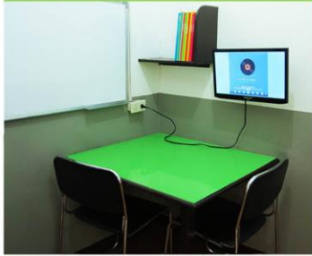
マンツーマンクラス