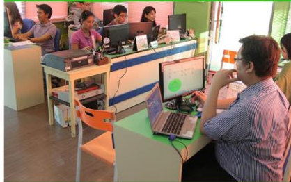
CIPの中心となるオフィス