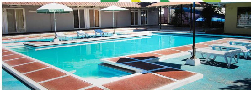
スイミングプール