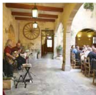
マルタの民族エンターテイメント