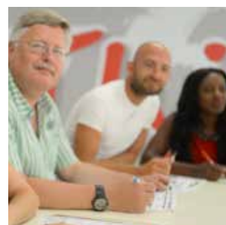
教室内の生徒さん