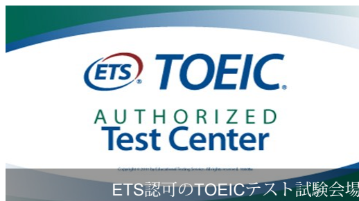
ETS認可のTOEICテスト試験会場