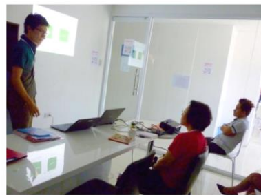
実践形式のプレゼン授業