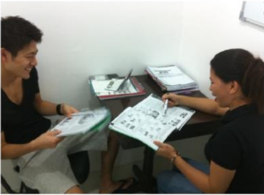
マンツーマン授業の風景①