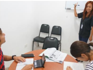
グループ授業の風景②