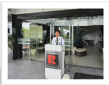
24時間ガードマン常駐