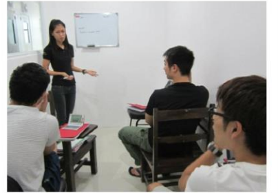
グループ授業の風景