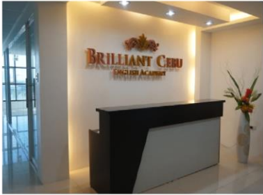
学校エントランス