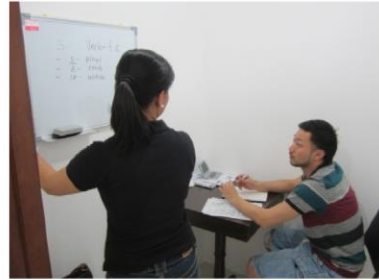
マンツーマン授業の風景②