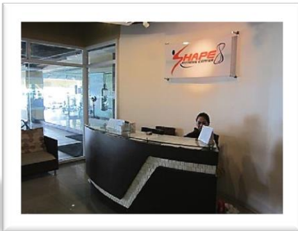
館内ジムのカウンター