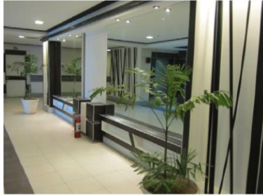
エレベーター前廊下