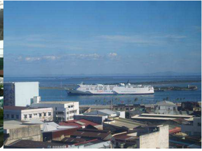
学校からの眺め(セブ港)