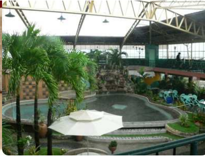
11階のプールとスカイラウンジ